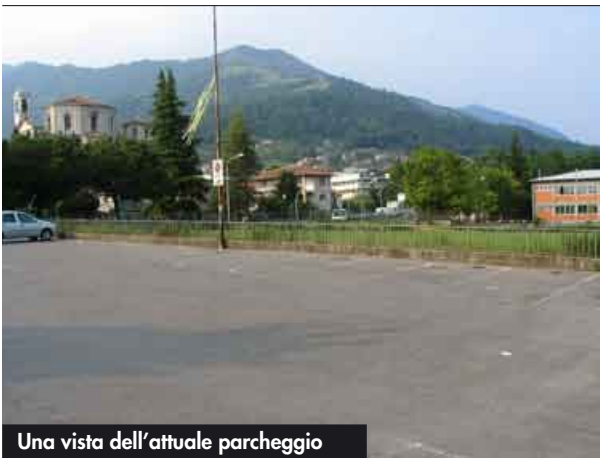
Una vista dell'attuale parcheggio

L'intervento di formazione del nuovo parcheggio in via Carso ha ottenuto un contributo a fondo perso di 135.000 Euro da parte della Regione Lombardia. ■