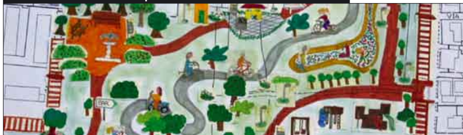
Anche i bambini hanno interpretato a modo loro il traffico di Nembro

ridurre il traffico, ma anche intervenire sull'arredo urbano. Per raggiungere questi obiettivi non è sufficiente un semplice intervento di segnaletica, ma occorre intervenire sulle infrastrutture. Tuttavia, per vedere gli effetti reali di riduzione del traffico bisognerà aspettare l'apertura della nuova strada statale, prevista da quanto riferito dall'Anas a febbraio dell'anno prossimo. Per quanto riguarda i parcheggi il Piano ne individua di nuovi per integrare quelli esistenti e recuperare la sosta di quelli che verranno dimessi. È prevista la realizzazione di parcheggi a raso nelle aree disponibili esterne ma prossime al centro dedicati alla sosta a lunga durata, come ad esempio il nuovo parcheggio che nascerà vicino al cimitero. Altri parcheggi sono previsti "in struttura", cioè sottoterra, da realizzarsi nelle immediate vicinanze del centro, regolamentati e a servizio della sosta a breve durata e della sosta dei residenti. ■